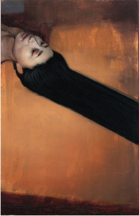
شكل (١٦) جي لويس - خطوط الرسم

محاولات الفنان جي لويس j- Louis (*) للتعامل مع الفراغ اتخذت أسلوباً غير تقليدياً، فهو يستخدم الخط عن طريق تحديد الأشكال، ويحدد الفراغ ويحصره، فالخطوط تكون موجبة نحو تحديد الشكل وسالبة في تحديد وحصر الفراغ، والفنان يعمل على الفراغ بإعتباره وحدة لونية تحقق الإنسجام الجمالي مع الشكل ( كتلة المرأة في العمل ) (شكل ١٥، ١٦) ، فأصبح الفراغ حاضراً ليس بالمعنى الواقعي أو المساحة اللونية الخالية من التكوين وإنما بالمفهوم المقابل لمعنى الكتلة بحيث يستند كلا منهما على الآخر في تحقيق حضوره (شكل ١٧). كما يحدث تبادلات متعمدة بين التسطيح والتجسيم تحول العديد من المساحات المرتبطة بالعناصر إلى فراغات والعكس، ليتحقق داخل أعماله تضافر واضح بين الكتل والمساحات يعتمد عليها بشكل أساسي البناء الفني .