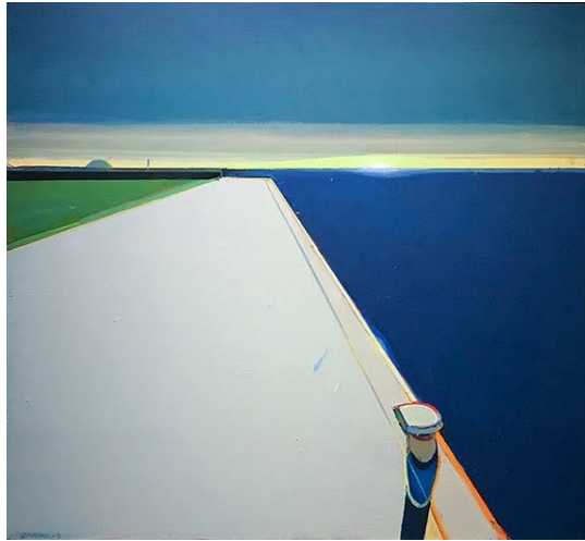
شكل (١١) Raimonds Staprans - الأحواض ليلا - زيت على توال - ٢٠٠٥