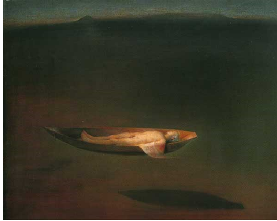
شكل (٨) Odd Nerdrum - رجل في مركب - زيت على توال

الأفراد الذين يسكنون لوحاتة مشبعون بهدوء كبير وسكون وهم علي قيد الحياة بشكل حيوي يستحضرون وحدانية كونية، لكنهم لم يتجاوزوا الفردية يرتدون ثيابا بدت صالحة لكل زمان (فراء وجلود وأغطية جلدية) تشبه ظروف نهاية العالم التي تضمنت مناظر طبيعية صادقة وشديدة في إشارة إلي مكان ما يتجاوز زماننا ومكاننا . يظهر في أعماله حضورا واسعا لمفهوم الفراغ الذي على أساسه تدرك قيمة الوجود وقيمة الموجودات الطبيعية والإنسانية .