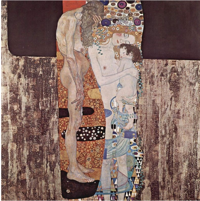
شكل (٤) جوستاف كليمت – ثلاث عصور للمرأة - زيت علي توال - متحف الفن الحديث بروما - إيطاليا - ١٩٠٥

عبر الفنان جوستاف كليمت(*) من خلال البناء التكويني والتصميمي لبنية الأشكال التي اتسمت بها أعماله الفنية في فضاء رحب تتصارع فيه العناصر بإنسجام وتناغم، تكررت الوحدات الزخرفية في وحدة واحدة وتوالت الأشكال من حيث السيادة من خلال الأشكال الرئيسية إلي الأشكال المحيطة في التكوين بعد أن تتابعت الأشكال الزخرفية شكلا وحجما ولون في (شكل ٤) تمثل الفضاء في العمل بتجزئة عناصر الموضوع وتقابل المساحات الملونة وتداخلها للتعبير عن فضاء تشكيلي، أظهر المزج بين الفن الكلاسيكي والأرت نوفو (الفن الجديد)، يظهر إهتمام كليمت بعناصر التكوين ابتداء من الشكل وإنهاء بالفضاء وعلاقته بالأشكال الزخرفية والكتل اللونية، وبهذا أنجز عمله وفق أبعاد جمالية من خلال المركزية التي اهتم بها كليمت، وفي ذات الوقت معتمدا علي الخلاصات الشكلية الهائلة في الفضاء الواسع والتكثيف الرمزي للأشكال الزخرفية وإنسجامها اللوني في العمل .