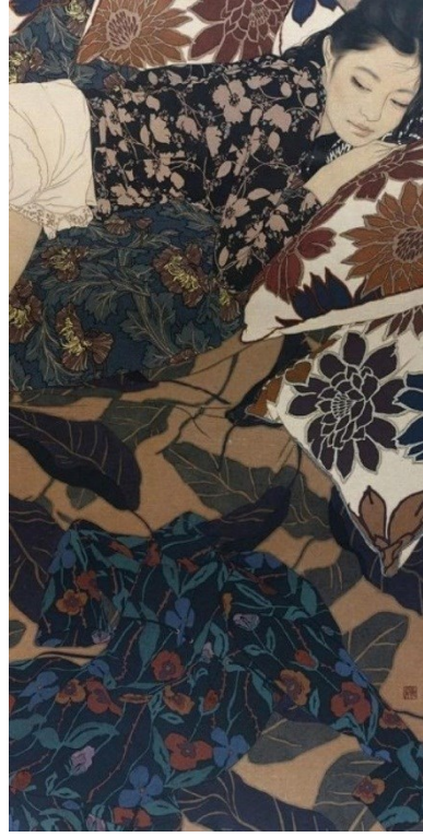
شكل (١٢) ياسوناري إكيناغا – Natsuko – ٢٠١٢