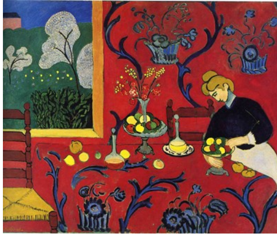
شكل (٣) هنري ماتيس - منضدة الطعام - تناسق الأحمر - زيت علي توال - متحف هرميتاج سان بطرسبورج - روسيا - ١٩٠٨

يظهر أسلوبه المتفرد في رؤية وخلق الشكل ضمن فهم جديد لفضاء اللوحة (شكل ٣) ، بعيداً عن المفهوم المنظوري التقليدي، حيث يتم خلق وهم الفراغ عبر تواصل خطوط سطح اللوحة، مكتفياً بالتسطيح و قوة اللون وجاذبيته ، فتتصل الأرض بالجدران وتختفي فيها الخطوط الرأسية والأفقية وفق علم المنظور فتبدو الأشكال و كأنها مسطحة في الفراغ .