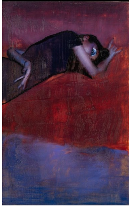
شكل (١٥) جي لويس - الطبقات