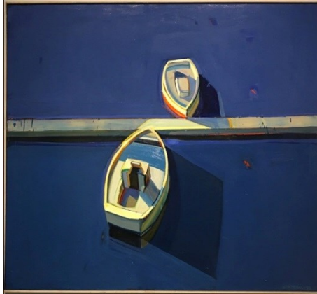
شكل (١٠) Raimonds Staprans - محادثة بين مركبين - زيت على توال - ١٩٩٥

إذا كان بعض الفنانين ينظر إلي الفراغ بوصفه مساحة خالية تحقق الإتزان لحضور الكتله في العمل الفني، وينظر إليه البعض الآخر بإعتباره جزءاً أصيلاً داخل العمل حيث يتحقق الفراغ من خلال الكتلة والعكس، في (شكل ١١) يتضح أن الفنان لا يعتبر الفراغ مساحة خالية تساعد فقط في تحقيق الإتزان اللازم لتأكيد حضور عناصره الأساسية وإنما يقوم البناء الأساسي للصورة على تلك العلاقات المتولدة بين فضاءات ملونة (مساحات) تحقق بذاتها الإتزان المنشود والعمل المستهدف دون اللجوء لتأكيد كتل رئيسية كمشغول في مواجهة فراغ .