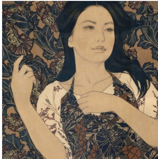
شكل (١٤) ياسوناري إكيناغا – Shima – ٢٠١٢