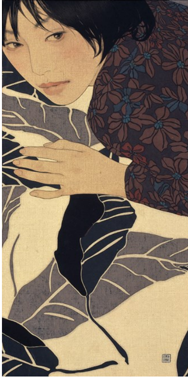
شكل (١٣) ياسوناري إكيناغا – Manami – ٢٠١١