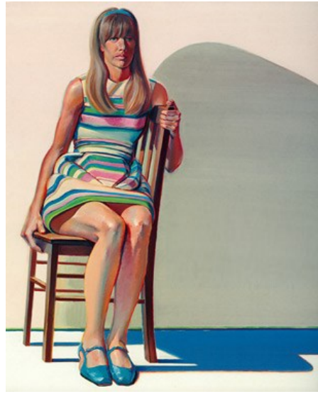
شكل (٧) واين ثياود - شخص - ٢٠٠٨

في أعمال الفنان نردروم (*) Odd Nerdrum يظهر اعتماده علي الفراغ الشاسع في اللوحة واستخدام الدرجات اللونية القاتمة، فالفنان يري في الفراغ عالمه الخاص الذي يؤسس فيه أشكاله بإسقاطات رمزية تشكيلية تحمل معاني تعبيرية وتنظيمية خاصة (وفق رؤي فكرية ونفسية جمالية) تضمنت مبالغت في اللون والحجم, فيظهر العنصر الرئيسي وحده في مساحة