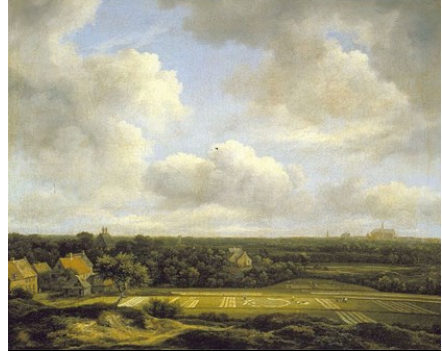
شكل (١) جاكوب فان رويسدل - منظر لهول هارلم شكل (٢) فاسيلي كانديسكي - أصفر أحمر أزرق - ١٦٦٠ - ١٩٢٥

الفراغ عنصر أساسي من عناصر بناء التصميم بما يمكن أن يثيره من قيم و علاقات بنائية وجمالية في العمل الفني ، فهو وسيلة لتحديد الأبعاد الفراغية ، و مصطلح الفراغ كما أشرنا يكتسب معناه حسب المجال الذي يستخدم فيه بمدلولاته المختلفة ، ففي مجال الفن الفراغ يمكن أن يكون له هدف يختلف عن مدلوله إذا ما أستخدم في مجال العلم . إن الفراغ كما يدرك في الفن يعبر عن قيم بنائية في العمل الفني ، ولم يعد التعبير عنه في الفن الحديث لمجرد إرساء كتله ساكنه به ، بل أصبح محاولة لتشكيل ذلك الفراغ ذاته .