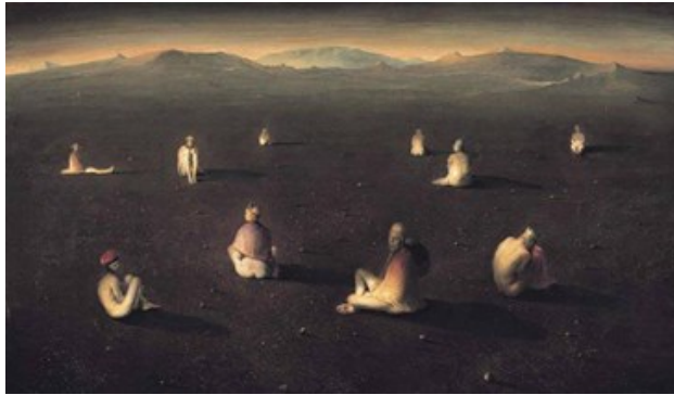
شكل (٩) Odd Nerdrum - المجانين - زيت على توال - ٢٠٠١