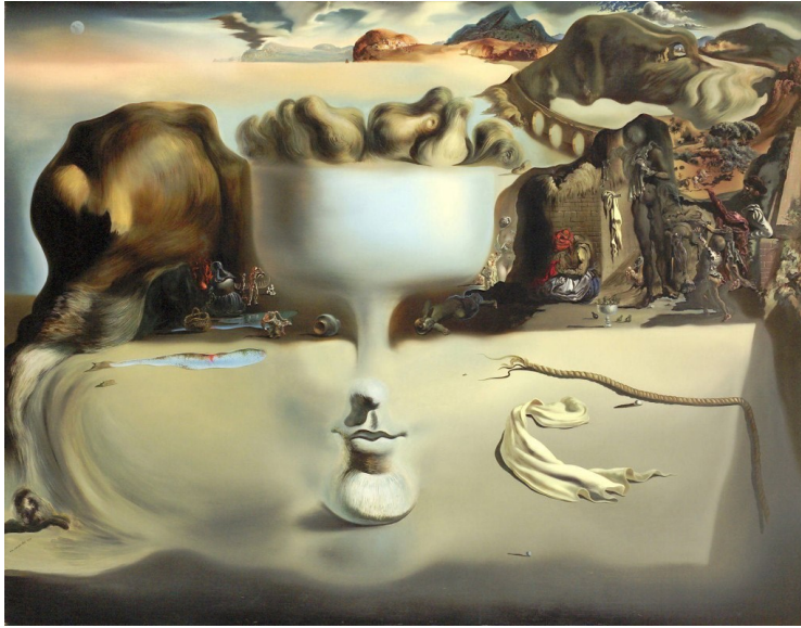
شكل (٥) سلفادور دالي – طيف شخص مع طبق فاكهة على شاطئ – ١٩٣٨

وكذلك الفنان سلفادور دالي(*) الذي قدم مجموعة من الأعمال التي تداخل فيها المشغول والفراغ بحيث يمكن رؤية كل منهما منفردا مرة كمشغول و مرة كفراغ (شكل ٥) . رسم دالي أربعة مشاهد ودمجهم في صورة واحدة وعن طريق الخداع البصري الموجود نكتشف المزيد من الصور المزدوجة والمتحولة، في تبادلية للعلاقة بين المشغول والفراغ بحيث يتبادل كلا منهما الأهمية في بناء العمل الفني .