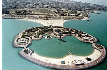
شكل رقم ١٨

وتعمل حاليا شركة المشروعات السياحية بمشروع معدل لتطوير الجزيرة الخضراء بالواجهة البحرية طالبة الموافقة عليه ويشمل المشروع تعديلات على الأنشطة القائمة، بحيث يشمل مواقف سيارات ضمن الموقع .