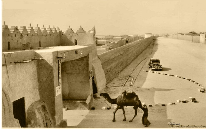
(شكل ٢) أسوار وبوابات الكويت، منطقة الشامية

و موضوع الدراسة (الجزيرة الخضراء) عبارة مساحات من الأرض تتميز بتنوع المناسيب والمستويات الأفقية المعمارية الممتدة عبر شارع الخليج العربي إلى داخل البحر يقضى فيها الناس عطلاتهم بشكل جديد يحقق لهم فرصة الهروب من زحام وضوضاء الحياة الحديثة والتمتع بجمال ونقاء البحر والطبيعية وممارسة الأنشطة وما يرتبط بها من ثقافات محلية، القديم منها والمعاصر.