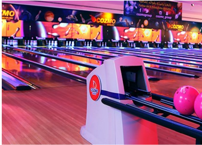
(شكل رقم ١٦) التنوع في العاب الاطفال مثلا كوزمو عالم للكبار والصغار