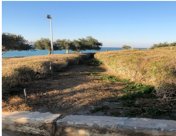
(شكل ٥) مساحات مهجورة