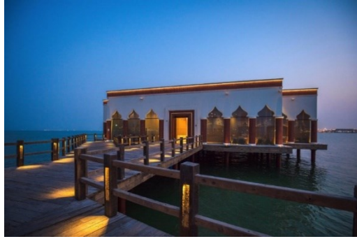
(صورة رقم ١٠) مطعم مرسى كتارافي قطر