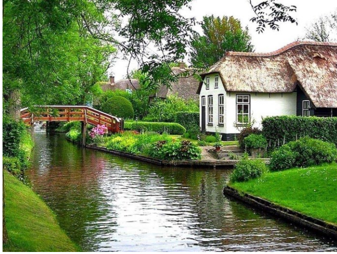
(شكل رقم ١٣) شكل نخر لقرية جيثورن في هولندا