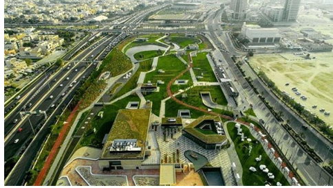
شكل رقم (٩) حديقة البوليفارد

شكل رقم ٨ حديقة الشهيد المساحة الخضراء واسعة النطاق ، منتشرة في انحاء الحديقة كما هو موضح في الصورة وهي الشكل المطلوب والمرغوب فيه شيرين احسان شيرزاد " الحركات المعمارية الحديثة " ١٩٩٩