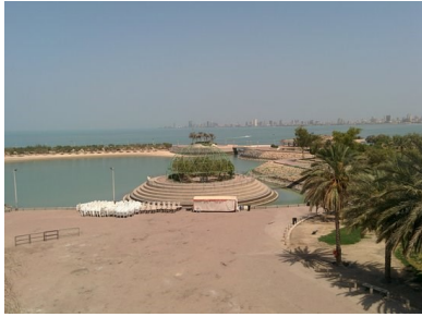
(شكل ٣) فراغات غير مستخدمة