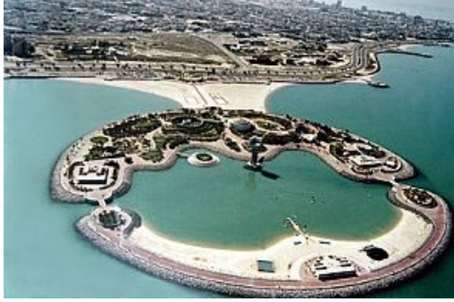
(شكل ٣) موقع الجزيرة الخضراء وشارع الخليج العربي

الجزيرة والاهتمام بالجانب الجمالي وزراعتها وإعادة الحياة فيها، حيث تفنّد الجزيرة العنصر الجمالي فيما يختص بالوظائف و تشكيل الفراغات.