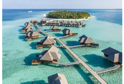
(صورة رقم ١١) جزر المالديف