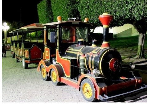
شكل رقم (١٧) قطار الجزيرة للأطفال يمكن تطويره حتى يكون بيئيا بالاستدامة