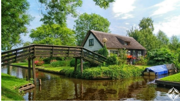
(صورة رقم ١٢) قرية جيثورن في هولندا