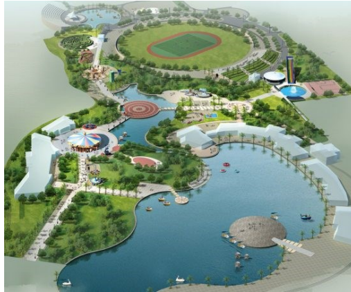
(شكل رقم ٩ مثال جيد للحدائق)