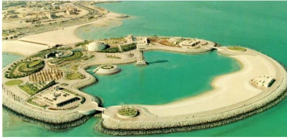
شكل رقم ١٩

هناك عدة اشكال للمسرح نختار المسرح على حسب العروض المقدمة وما يعبر عنا او الهوية الوطنية ربما أو عروض جديدة يتم تبنيتها لإبهار الاطفال والاستفادة للكبار و التعليم للمراهقين . مخطط الخريطة المقترح الذي يضم الانشطة السابقة المذكورة في الاعلى شكل رقم ١٨-١٩-٢٠