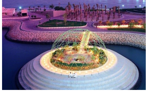
شكل رقم (٧) الجزيرة تضم عدة مروجٍ خضراء تتخللها ممرات لم تستغل