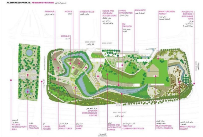
(صورة رقم ٢)

إضافة ما يسمى بالفن الذي يساعد و بشكل كبير في إظهار عنصر الجميل للجزيرة , لانها مدينة مائية تحتاج لتلك الإضافات و خلق جو للاسترخاء و الترفيه و يكون مريح للنظر كما نرى اليوم في تحول ( الحزام الاخضر إلى حديقة الشهيد ) (صورة رقم ٨ و ٩ ) الموجودة في داخل الكويت بمنطقة شرق تحولت من ممر للمشاة خالي من المساحة الخضراء الى حديقة جميلة فيها تنوع كبير في النباتات و توفر جميع المطالب الترفيهية و الاحتياجات الاساسية .للحركة الفنية دور , حديقة البوليفارد ايضا مثال جيد وجميل موضح في (صورة رقم ١٠) .