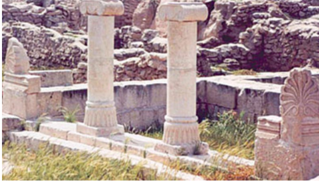
(شكل ١) جزيرة فيلكا، مزيج من الحضارات بالكويت

ويعود الوجود البشري في منطقة الكويت إلى أكثر من ثلاثة آلاف عام، كما تشير بقايا الآثار التي عثر عليها في جزيرة فيلكا (شكل ١)، ويرجع ذلك إلى موقع الكويت المتميز الذي جعلها حلقة وصل برية وبحرية بين أجزاء العالم القديم، والذي مكنها من التحكم في الممرات إلى تلك الحضارات.