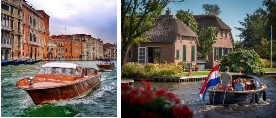
شكل رقم ١٤ الرحلة البحرية في قرية جيثورن في هولندا