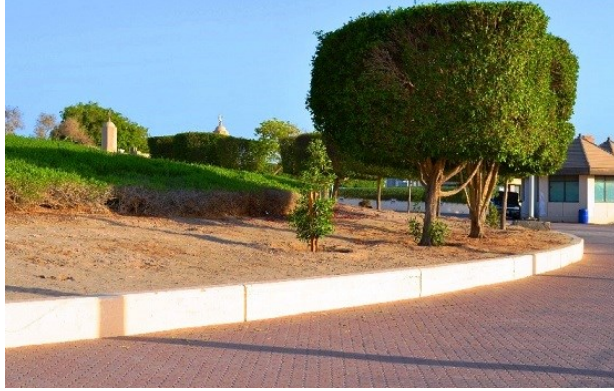
شكل رقم (٦) أماكن طبيعية لم تستغل