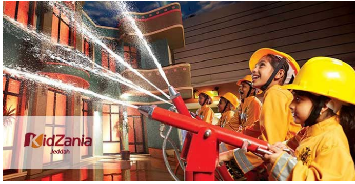
(شكل رقم ١٥) عالم كيدزانيا

تم إنشاء أول لعبة هروب حقيقية في عام ٢٠٠٦ في ولاية كاليفورنيا بالولايات المتحدة ومنذ ذلك الوقت، أصبحت اللعبة ظاهرة الترفيه الجديدة.